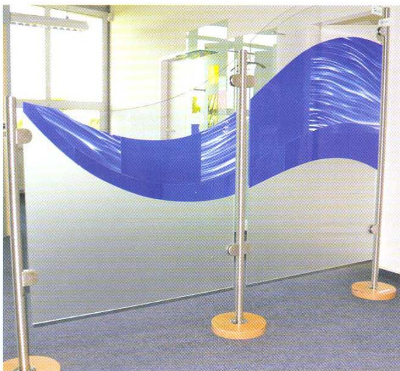
„Paravent“ von Martina Schulz LambertsGlas® Überfang auf ESG 170 x 120 cm

Dank der modernen Verarbeitungsverfahren, insbesondere der Klebetechnik mit Zweikomponenten-Silikon, gibt es kaum noch Grenzen, was Gestaltung und Einsatzmöglichkeiten anbelangt. Über 40 Glaskünstler und -handwerker realisier-