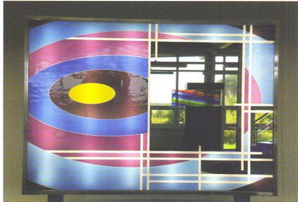
Glasbild mit Spiegel, hinterleuchtet von Karl-Heinz Tute LambertsGlas® Überfang 170 x 120 cm

ten ihre ganz persönlichen gläsernen Wohnräume: von der klassischen Türfüllung bis zum Solitär Möbel.