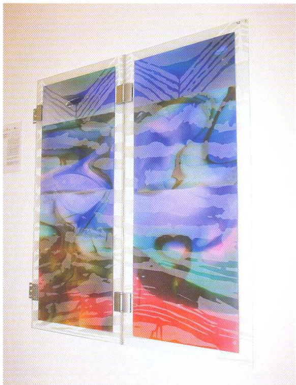
Doppelduschtür für Badewanne von Christian Bressler LambertsGlas® Überfang auf 6 mm ESG

LambertsGlas® – echt ist nur das Original.